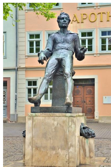
Der junge Johann Sebastian Bach in Arnstadt.